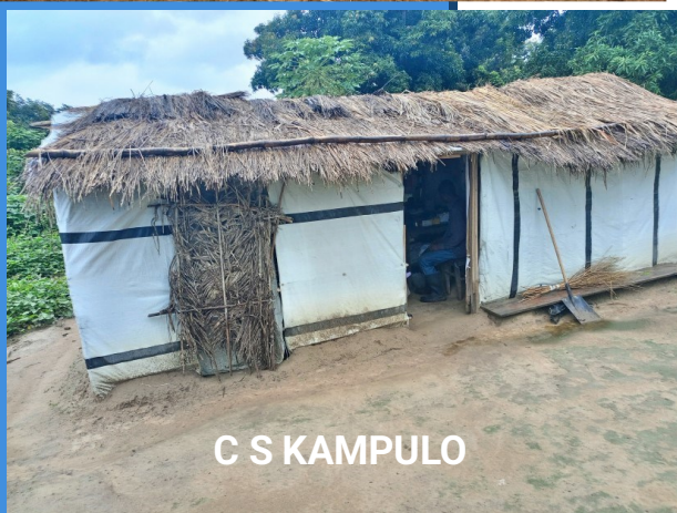
C S KAMPULO