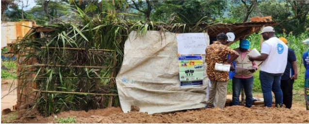
Le CS de l'AS Kabeya Mukena