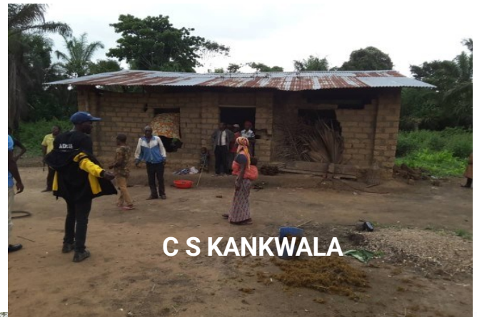
C S KANKWALA