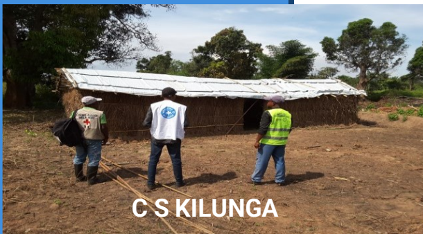
C S KILUNGA