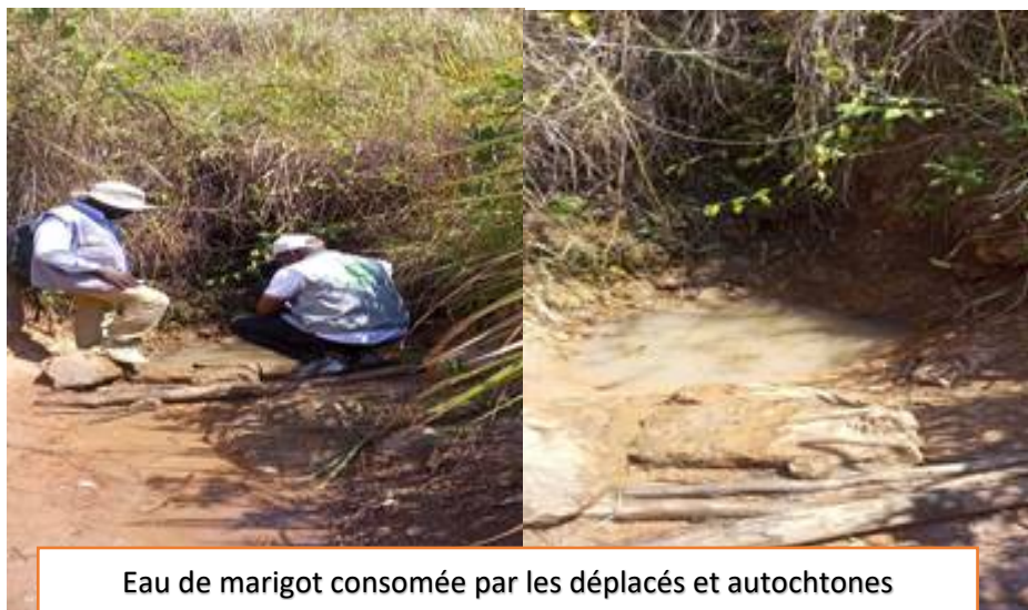
Eau de marigot consommée par les déplacés et autochtones