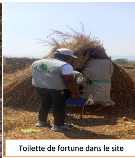
Toilette de fortune dans le site