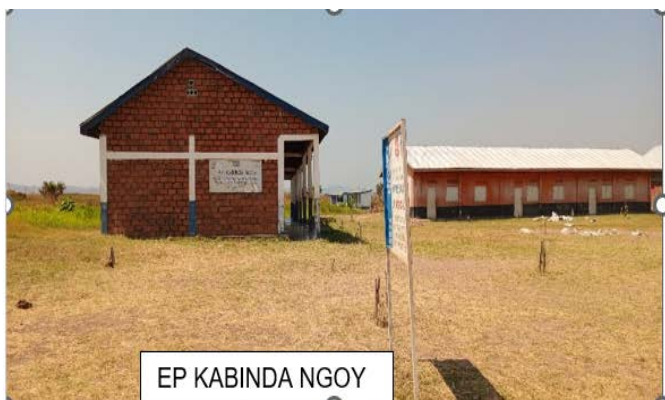
EP KABINDA NGOY