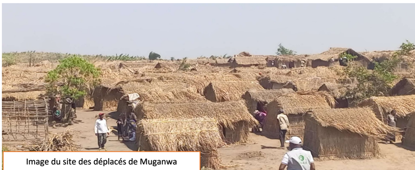
Image du site des déplacés de Muganwa