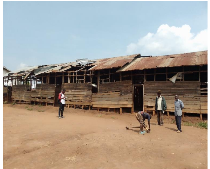
Bâtiment EP Mirangi à Kibirizi, Photo HEKS/EPER du 11/07/2024.

Une assistance en éducation à travers la construction/réhabilitation des écoles et la distribution des kits scolaires est vivement recommandée dans la zone.