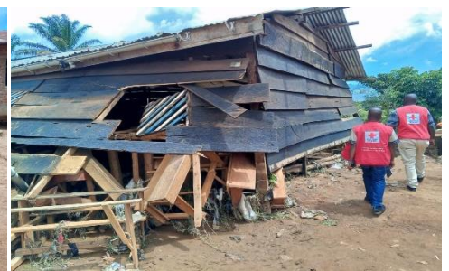
Visite des écoles endommagées