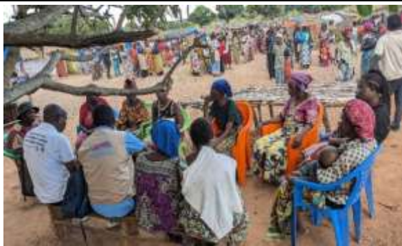
Figure 3: Rencontre avec les femmes du sites des IDPs de Mpelembe à Pweto. 18/04/2026