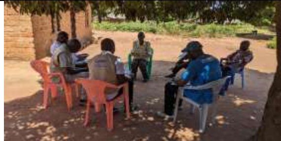
Figure 2: Rencontre avec différents informateurs clés dans quartier Lunkinda/Pweto, le 20/05/2026