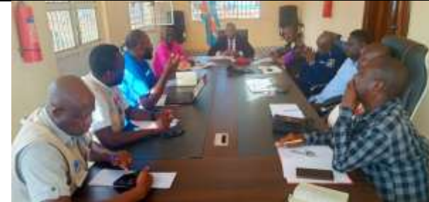
Figure 1: Rencontre avec l'Administrateur du territoire Assistant chargé de la Politique et Administration avec différents services concernés dans évaluation. Bureau du territoire de Pweto, 20/04/2026