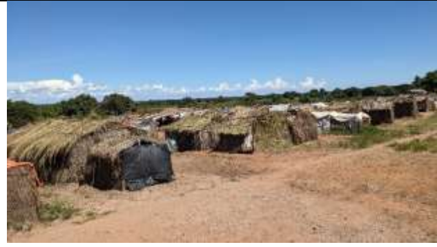
Figure 4: Site de Kipambala, image des huttes constuites en paille. 19/06/2026