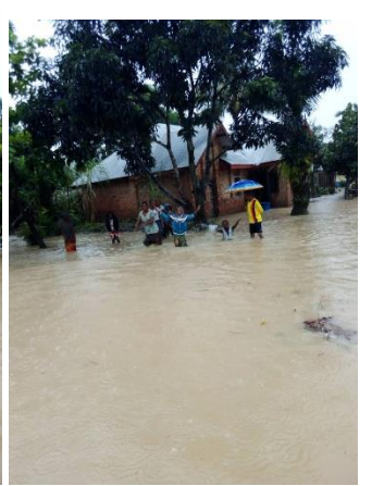
Kindu et particulièrement Alunguli sont l'eau. Un dégât matériel trop lourd