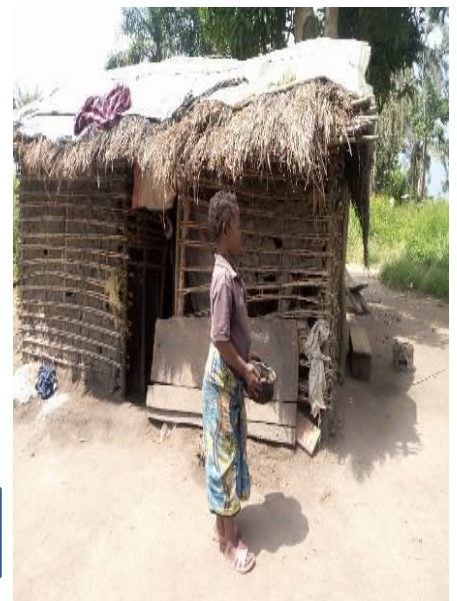
Type d'Abri d'un ménage déplacé et l'image de la casserole utilisée