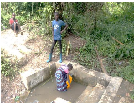
Type d'une source aménagée et non protégée avec un débit faible