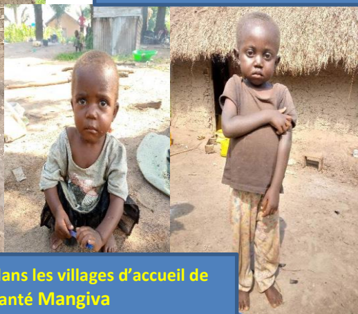
Les enfants malnutris dans les villages d'accueil de l'Aire de Santé Mangiva