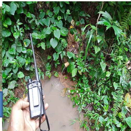
Type d'une source potentielle utilisée par les IDPs