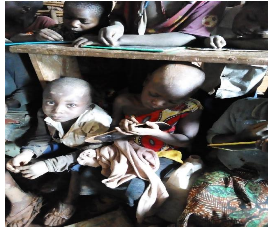
Pas d'espace dans les salles de classes