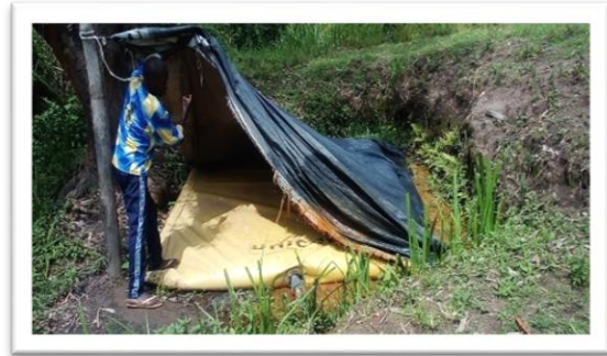
Qualités des ouvrages au point de puisage