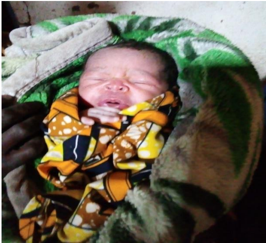
Un enfant né à domicile faute des frais d'accouchement