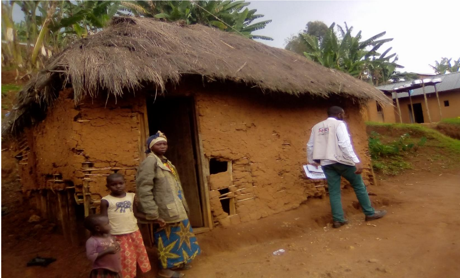
Image de la visite d'une maison habitée par un ménage déplacé dans le quartier Kinahwa, Lubero, Nord Kivu