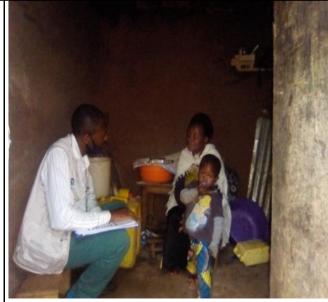
Enquête dans un ménage idps