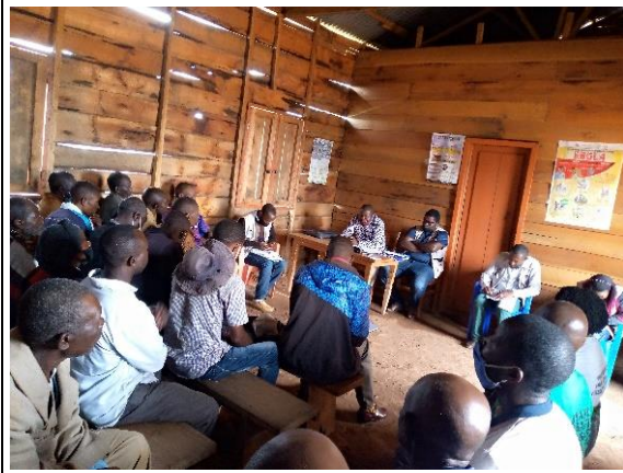
Rencontre avec différentes couches