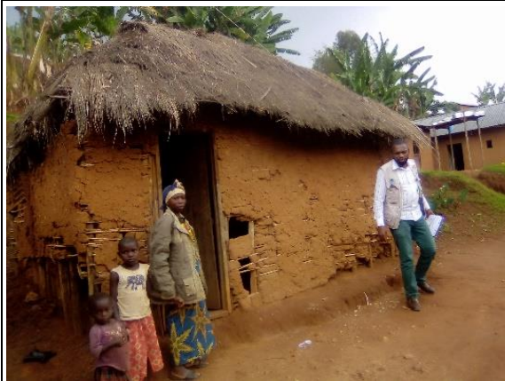
Visite d'un ménage déplacé