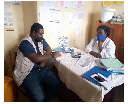
Visite dans les structures sanitaires