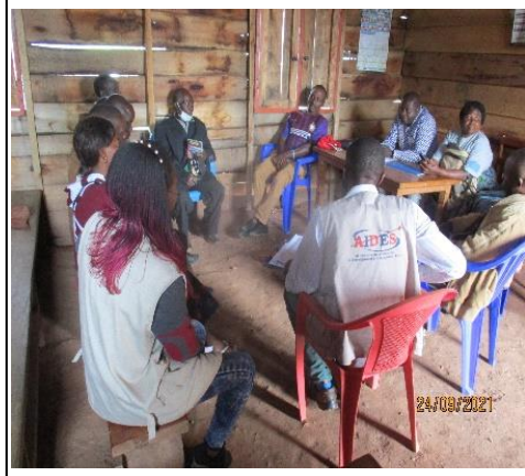
Travail en FOCUS GROUP